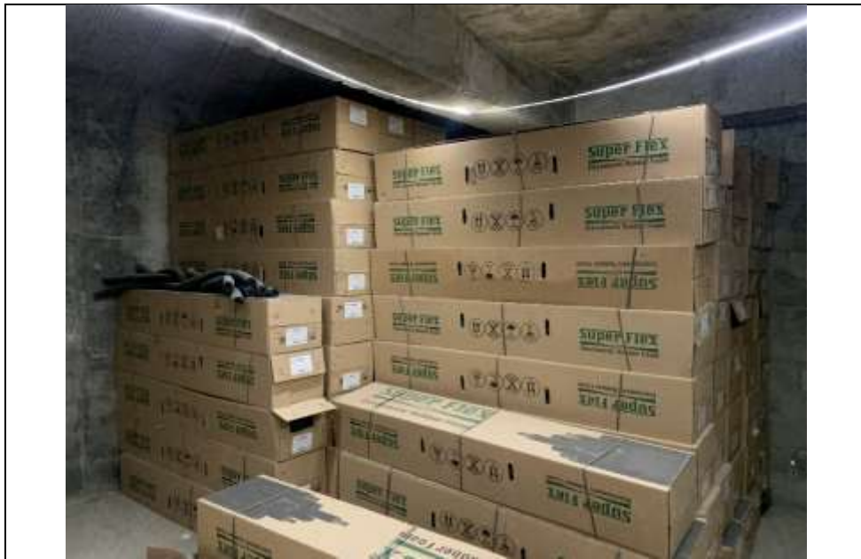
موضوع کاری: خرید و تخلیه عایق الاستومری