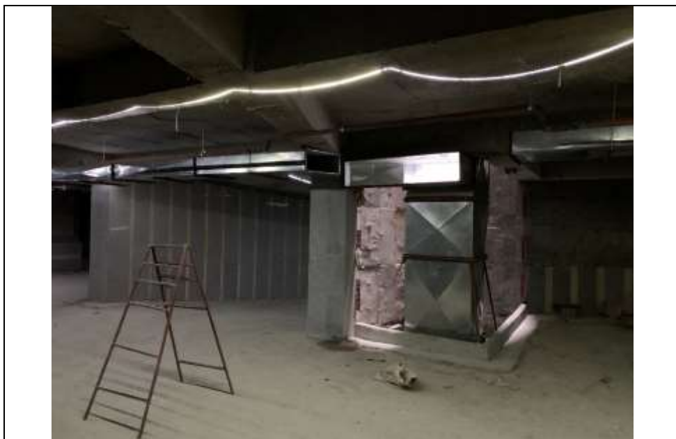
موضوع کاری: اجرای رایزر کانال های هوای تازه و تخلیه هوای پارکینگ ها در هر دو بلوک