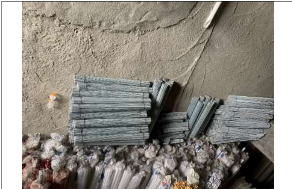
موضوع کاری: خرید پیچ متری جهت نصب کانال