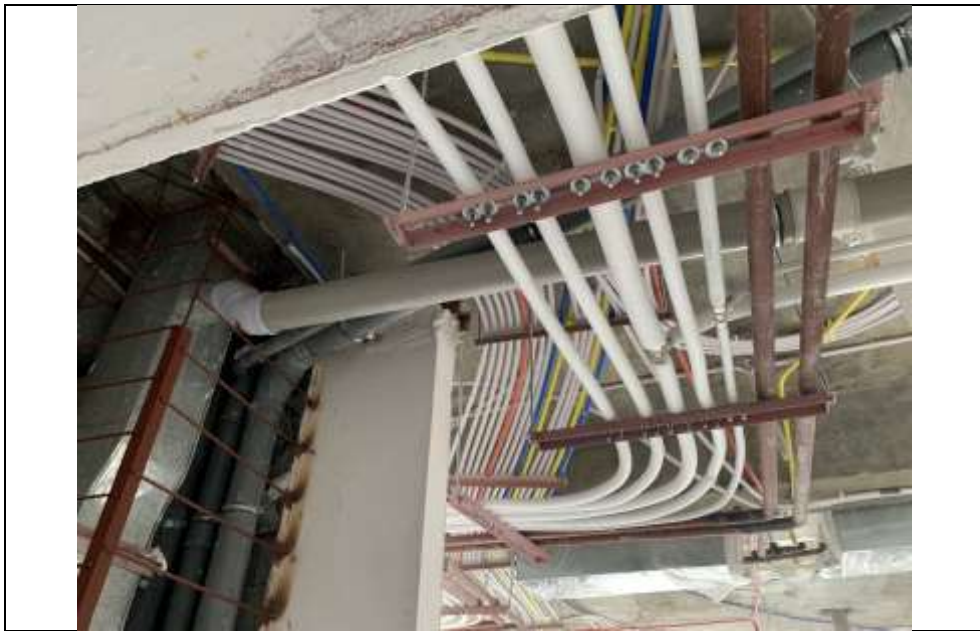
موضوع کاری: اجرای لوله تخلیه هوای سروس و عایق لوله بلوک B