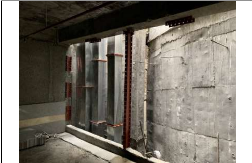
موضوع کاری: اجرای رایزر کانال تخلیه هوای استخر