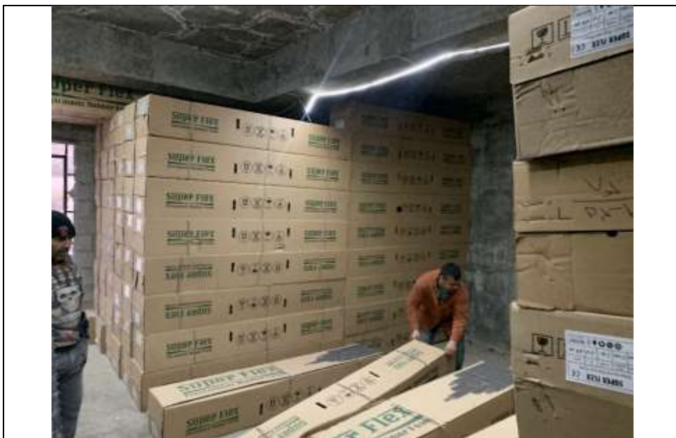
موضوع کاری: خرید و تخلیه عایق الاستومری