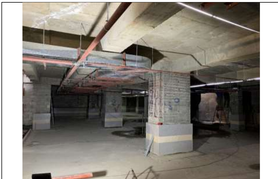
موضوع کاری: اجرای لوله اسپرینگلر و کانال هوای تازه و تخلیه دود پارکینگ ها