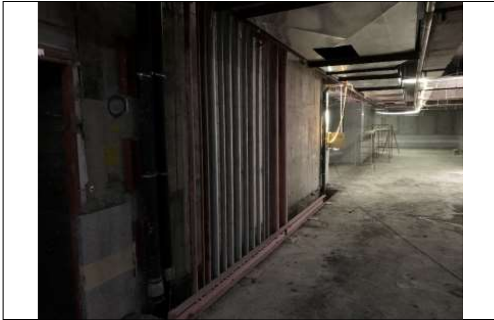
موضوع کاری: اجرای لوله های رایزر اصلی از طبقه 5- (موتورخانه) تا طبقه 15 بلوک B