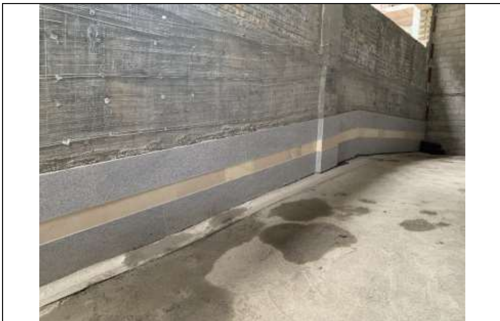
موضوع کاری: اجرای توری رابیتس در طبقات زیر زمین