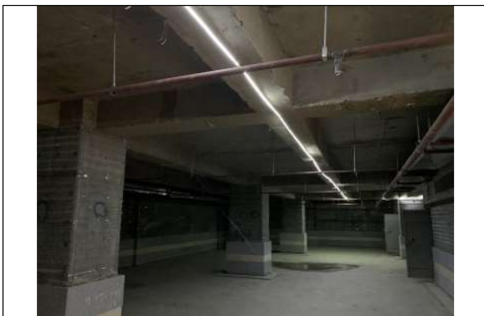
موضوع کاری: اجرای لوله اسپرینگلر طبقه 2- بلوک C